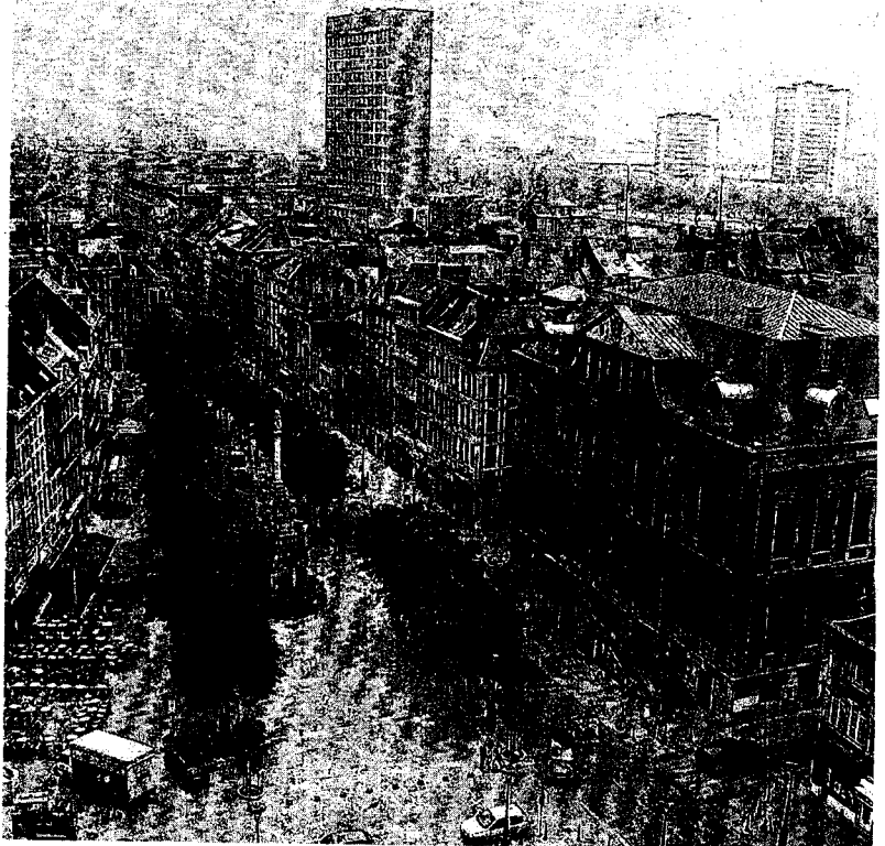
"Liège ne doit pas attendre l'homme providentiel ou LE grand projet financé par les Chinois" ■ E. DESTINE

Se poser la question des grands projets autour desquels fédérer les intelligences. Ne pas attendre l'homme providentiel ou même LE grand projet financé par Bush, par Bill Gates ou par les Chinois. Il faut fédérer les bonnes volontés, investir dans l'éducation et les qualifications professionnelles. C'est une révolution culturelle à accomplir. Faire comprendre aux gens que l'avenir leur appartient pour autant qu'ils soient acteurs. Cela implique une révolution au niveau des comportements. À vous de jouer!