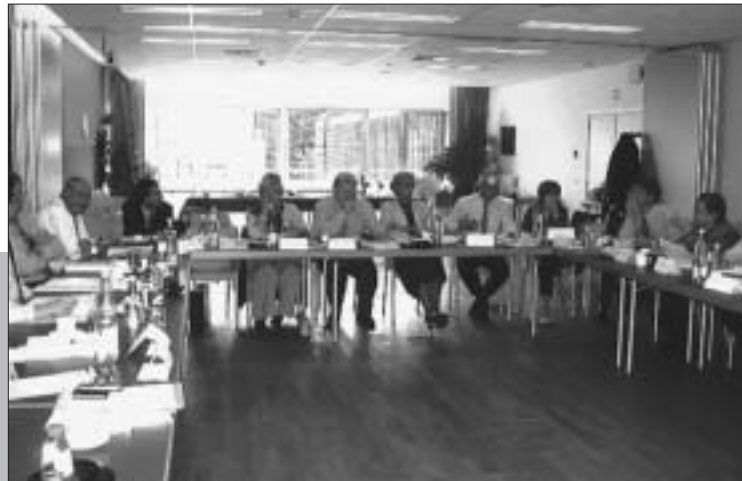
Session plénière sur les macro-scénarios

Si la couverture géographique choisie est le territoire provincial, la démarche tient compte, en fonction des thématiques abordées, de l'intégration dans un espace plus large comme des logiques sous-régionales qui forment la réalité de la province.