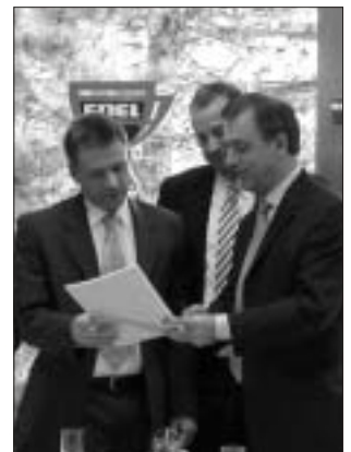
Le Ministre Michel Foret entouré des dirigeants de l'entreprise

sur 3 sont programmées et réalisées par la suite. Ce 29 octobre, Edel, une entreprise de lyophilisation du café installée dans le parc de Grâce-Hollogne, s'est vue remettre des mains du Ministre wallon de l'Environnement Michel Foret le 700 ème rapport environnemental rédigé par l'UWE.